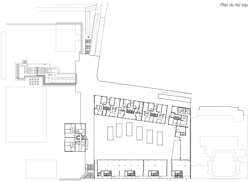
Plan du rez square

Du point de vue architectural cela se traduit par un socle vitré, unifié par une grande colonnade, le long de l'avenue de la Gare. Le socle abrite les commerces au niveau de la rue et des bureaux au niveau de la coursive. Un corps de bâtiment et un couronnement en retrait, proposant un langage classique et urbain de murs et d'ouvertures, contient les logements. La colonnade déployée le long de l'avenue de la gare remplit des rôles multiples, à la fois statique afin de porter le volume des logements, d'unification architecturale du socle, dans sa hauteur et sa longueur, permettant de suggérer l'ampleur de l'offre commerciale du complexe, et de support d'enseignes.